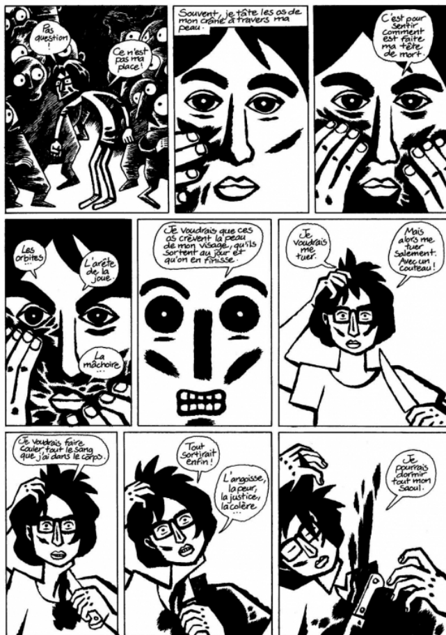
Fig. 1 : David B., L'Ascension du Haut Mal