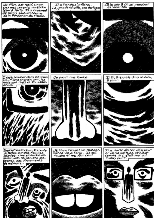
Fig. 3 : David B., L'Ascension du Haut Mal