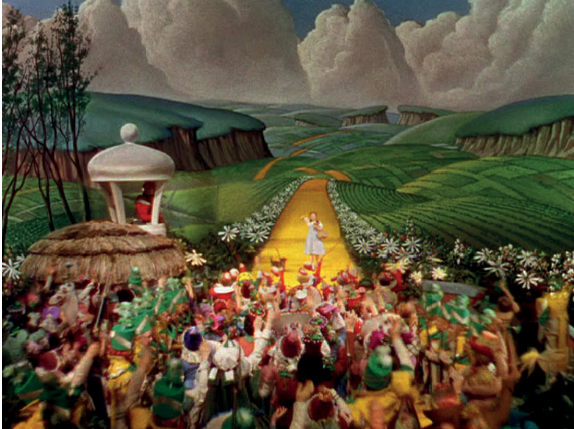
Fig. 3: Victor Fleming, The Wizard of Oz , Metro-Goldwyn-Meyer et Loew's Incorporated, 1939.

Comment sous-titrer le sémantisme suggéré d'une œuvre audiovisuelle ?