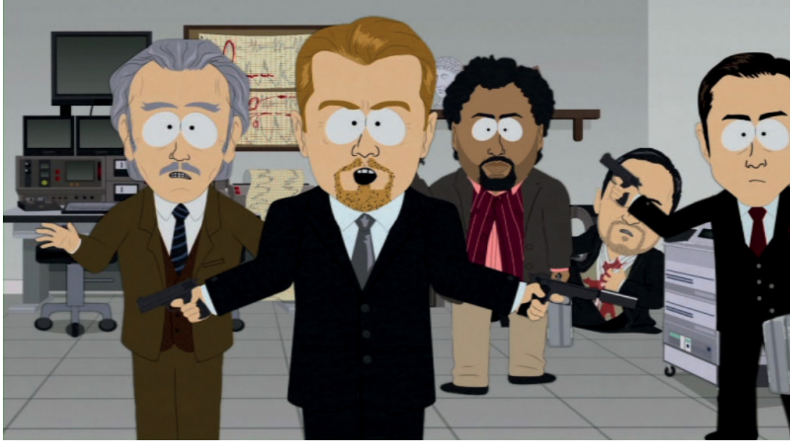
Fig. 2: Trey Parker et Matt Stone, « Insheption », S14e08, Comedy Partners et TF1 Vidéo, 2012